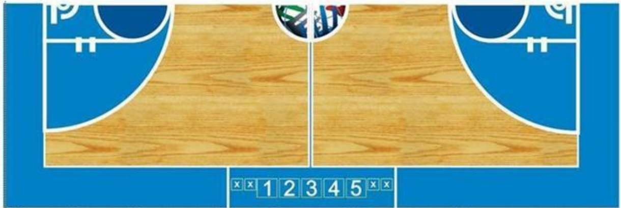
1. Мерач на 24 секунди 2. Мерач на време 3. Делегат 4. Записничар 5. Помошен записничар X. Столчиња за замени на играчи

24.5 Организаторот е должен на записничката маса да обезбеди прибор: