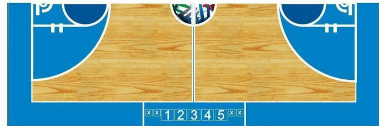
1. Мерач на 24 секунди 2. Мерач на време 3. Делегат 4. Записничар 5. Помошен записничар X. Столчиња за замени на играчи

24.2 Записничката маса мора да биде најмалку 4 метри долга.