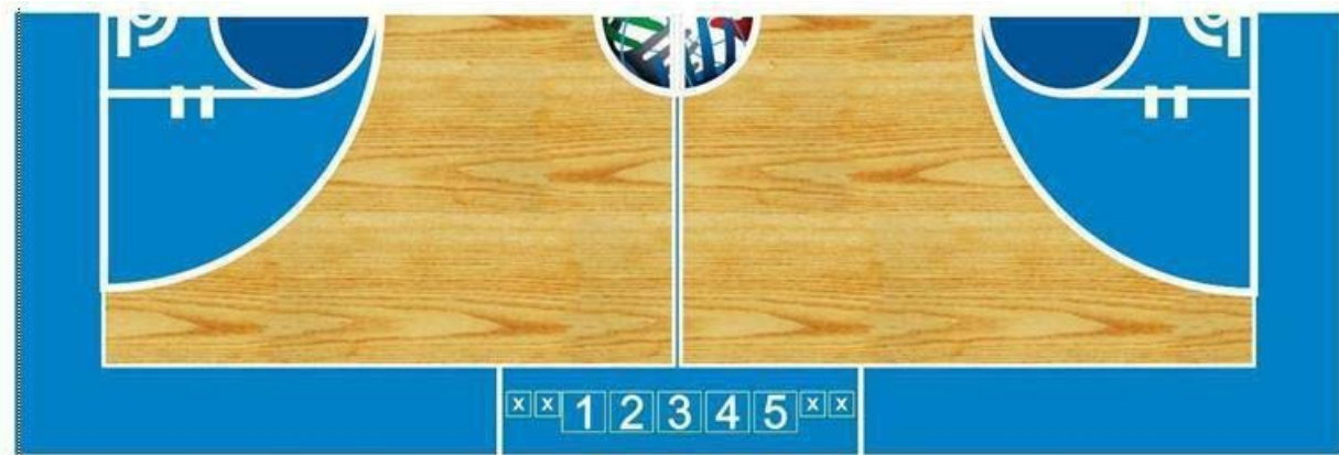
1. Мерач на 24 секунди 2. Мерач на време 3. Делегат 4. Записничар 5. Помошен записничар X. Столчиња за замени на играчи

24.2 Должината на записничката маса мора да изнесува најмалку четири (4) метри, и на неа може да се наоѓаат службени лица по утврден распоред: