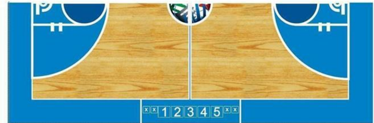
1. Мерач на 24 секунди 2. Мерач на време 3. Делегат 4. Записничар 5. Помошен записничар X. Столчиња за замени на играчи

24.5 Организаторот е должен на записничката маса да обезбеди прибор: