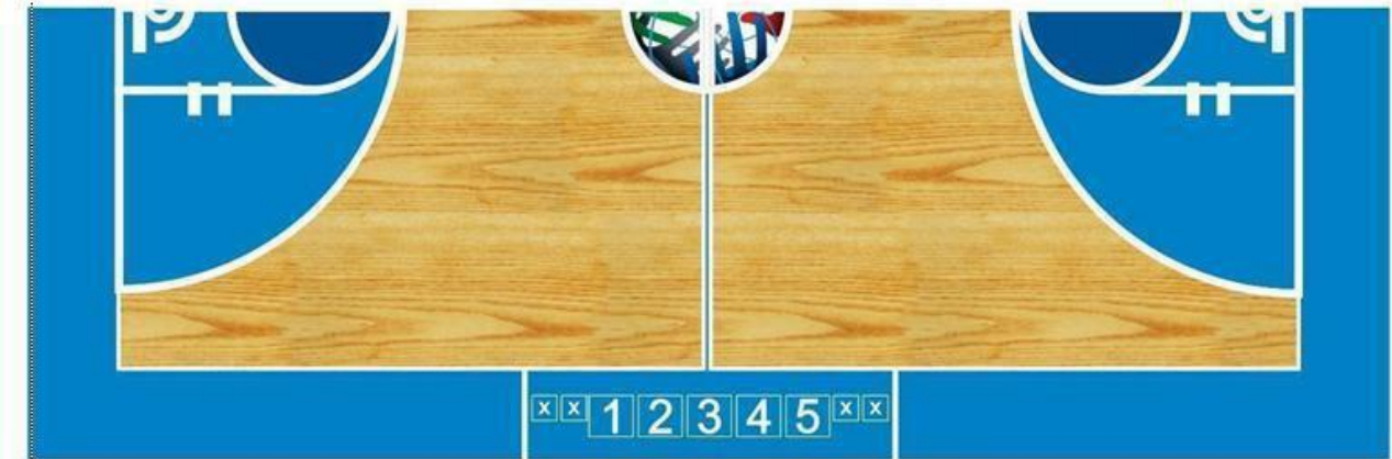
1. Мерач на 24 секунди 2. Мерач на време 3. Делегат 4. Записничар 5. Помошен записничар X. Столчиња за замени на играчи

24.2 Записничката маса мора да биде најмалку 4 метри долга.